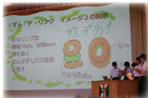
「iNAゼミ」(稲川ゼミナール) 湯沢市立稲川中学校